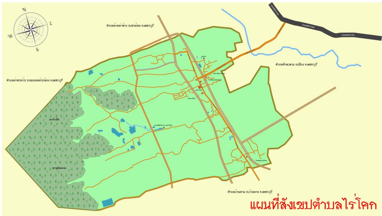
แผนที่สังเขบทำบลไร่โคก อำเภอบ้านลาด จังหวัดเพชรบุรี

หมายเหตุ : ข้อมูล ณ มกราคม ๒๕๖๑ สำนักบริหารการทะเบียน กรมการปกครอง อำเภอบ้านลาด