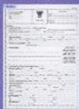
แบบคำขอจดทะเบียนพาณิชย์ (แบบ กพ.)