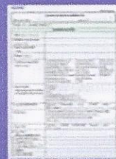
เอกสารประกอบการจดทะเบียน พาณิชย์อิเล็กทรอนิกส์

(กรณีไม่ได้เป็นเจ้าของบ้านต้องมีเอกสารดังนี้ หนังสือยินยอมให้ใช้สถานที่ และสำเนาทะเบียนบ้านหรือสำเนาสัญญาเช่า หากไม่ได้ดำเนินการด้วยตนเองต้องมีหนังสือมอบอำนาจ และสำเนาบัตรประชาชนของผู้รับมอบอำนาจ)