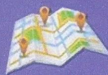
แผนที่ตั้ง กิจการ