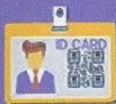
สำเนาบัตรประชาชน เจ้าของกิจการ