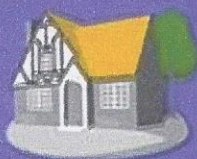
สำเนาทะเบียนบ้าน เจ้าของกิจการ