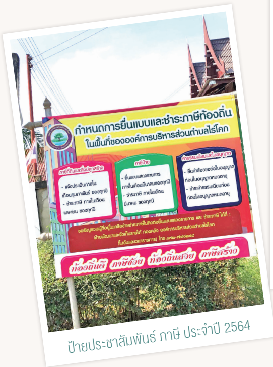
ป้ายประชาสัมพันธ์ ภาษี ประจำปี 2564