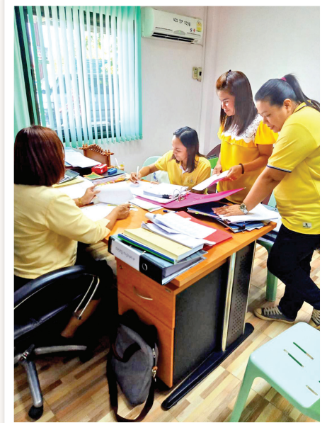
รับตรวจงานการเงิน บัญชีและพัสดุ