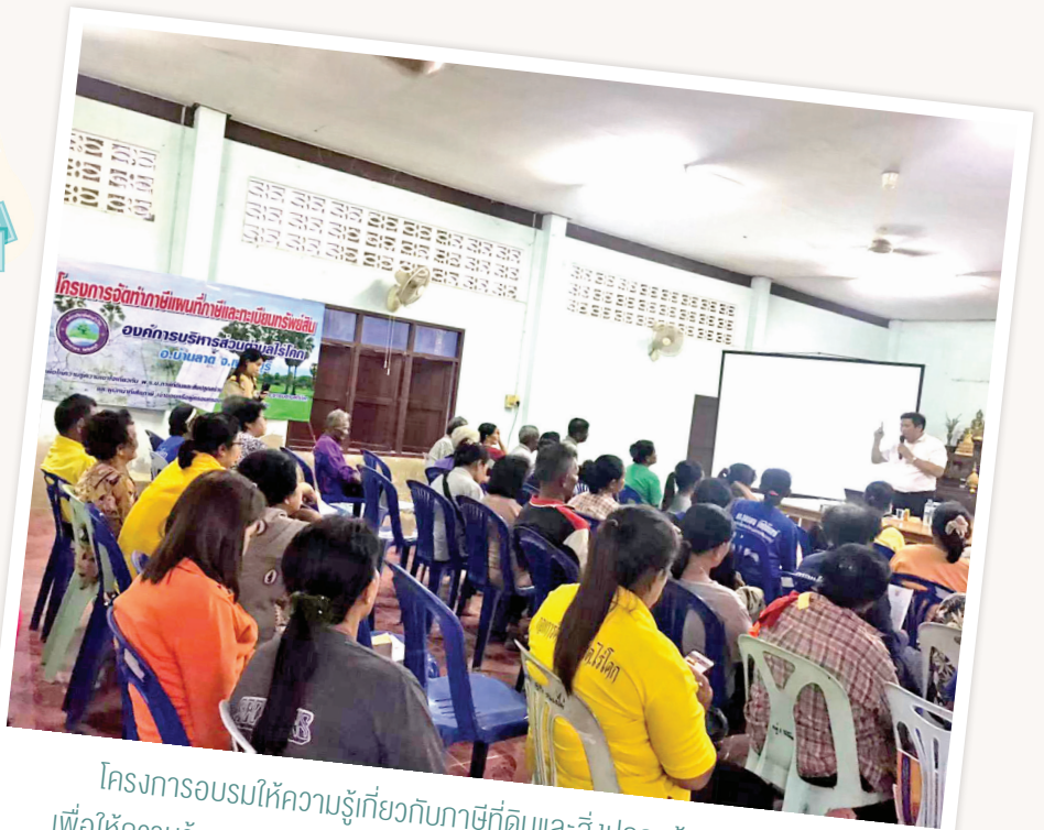
โครงการอบรมให้ความรู้เกี่ยวกับภาษีที่ดินและสิ่งปลูกสร้าง พ.ศ. 2562 เพื่อให้ความรู้ความเข้าใจเกี่ยวกับ พ.ร.บ.ภาษีที่ดินและสิ่งปลูกสร้าง พ.ศ. 2562