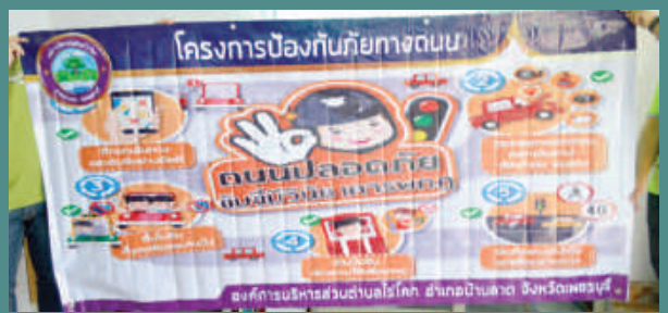
โครงการรณรงค์ขับที่ปลอดภัย