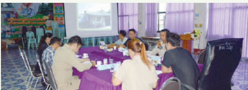
การประชุมช่วยเหลือผู้ประสบเหตุวาทภัยภายในตำบลไร่โคก