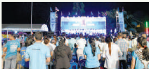
โครงการจัดงาน วันเฉลิมพระชนมพรรษา สมเด็จพระนางเจ้าสิริกิติ์ พระบรมราชินีนาถ ในรัชกาลที่ 9