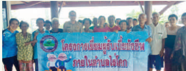
โครงการ เยี่ยมผู้รับเบี้ยยังชีพ ภายในตำบลไร่โคก