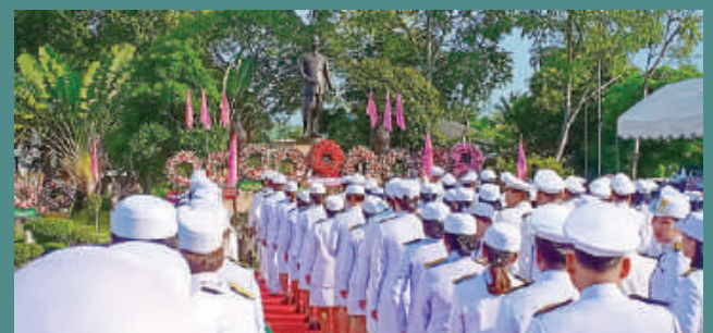
โครงการถวายพวงมาลาสักการะ ร.5