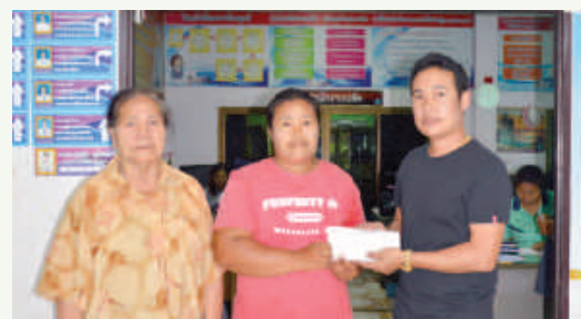
โครงการลงพื้นที่สำรวจข้อมูลพื้นฐานครัวเรือน